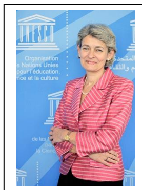
นางอิรีนา โบโกวา (ผู้อำนวยการใหญ่ยูเนสโก)

การประชุมสมัยสามัญจัดให้มีขึ้นทุก ๆ ๒ ปี คณะกรรมการประกอบด้วยผู้ทรงคุณวุฒิด้านการศึกษา วิทยาศาสตร์ และวัฒนธรรม จำนวน ๕๘ คน โดยเลือกจากผู้แทนของประเทศสมาชิก กรรมการจะอยู่ในวาระคราวละ ๔ ปี และจัดให้มีการเลือกตั้งกรรมการใหม่ครั้งหนึ่งทุก ๒ ปี ผู้อำนวยการใหญ่ ซึ่งเป็นเจ้าหน้าที่สูงสุดขององค์การ จะอยู่ในวาระคราวละ ๖ ปี ผู้อำนวยการใหญ่คนปัจจุบันคือ นางอิรีนา โบโกวา