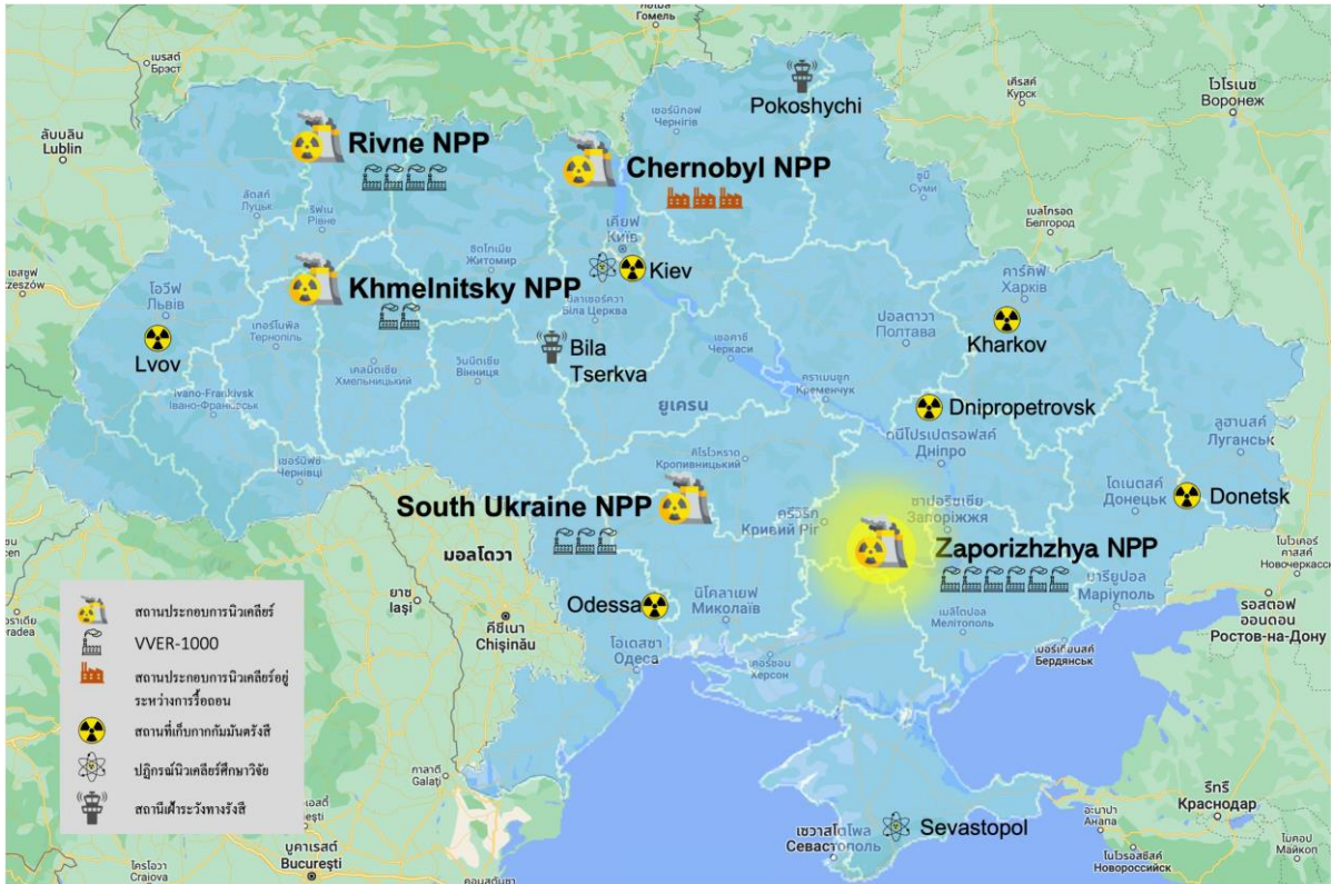
โรงไฟฟ้านิวเคลียร์ซาปรีเซีย (Zaporizhzhya) ซึ่งอยู่ทางตอนใต้ของประเทศยูเครน

ศูนย์ปฏิบัติการฉุกเฉินทางนิวเคลียร์และรังสี โทร. 0 2596 7600 ต่อ 3104, 3107